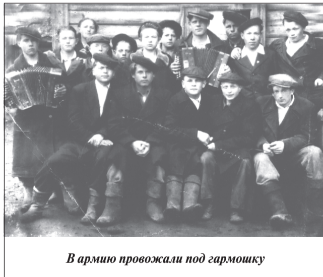
В армию провожали под гармошку

Лен таскали вручную, везли на ток, где колотили. Потом каждая семья складывала подготовленные снопики, и их пересчитывали в трудодни. Затем увозили на луга и расстилали для просушки. Треляли тоже вручную. Получалась треста, которую женщины в ночь везли на лошадях в Нерехту. Мужчин было мало, да и пришли с войны многие инвалидами. А уходя на фронт, почти каждый из них оставлял дома не только пятерых-шестерых, а то и больше детей, но и беременную жену.