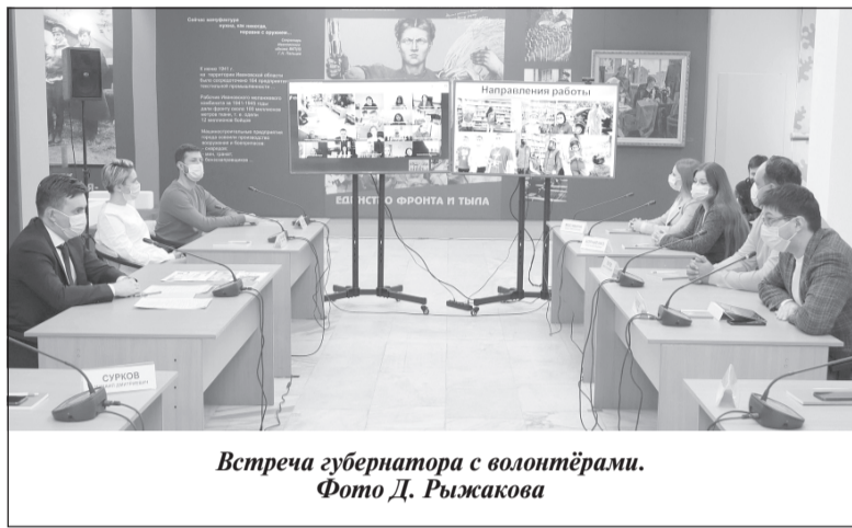
Встреча губернатора с волонтерами.