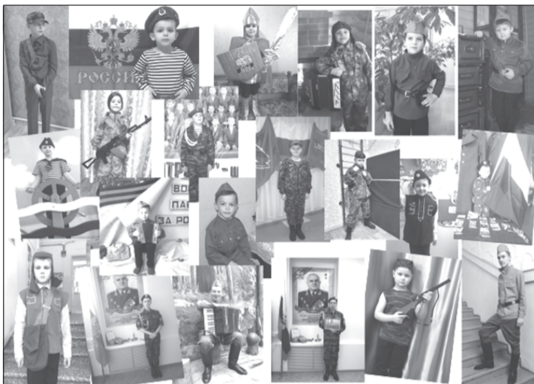
Участники конкурса в онлайн-формате

21 участник представил на суд пользователей соцсетей и жюри визитную карточку, фото в образе сказочного или литературного героя, видео-клип «Я супер Герой» (мир увлечений) и фото в военной форме.