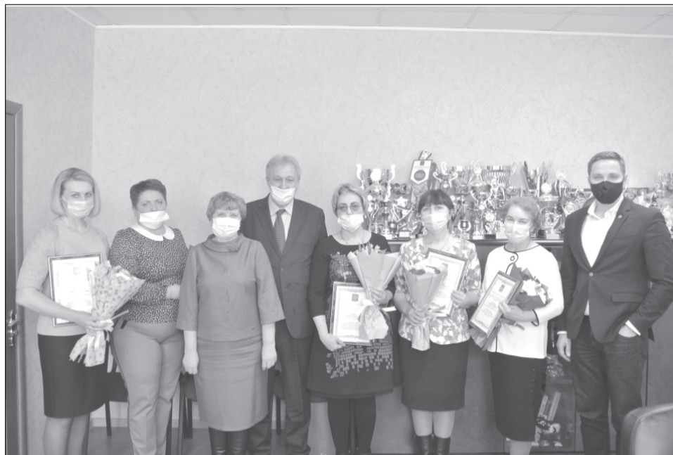
Юрий Смирнов поздравил женский коллектив предприятия «Приволжский ювелир» с наступающим праздником

Во время рабочей поездки в Приволжский район депутат Госдумы, член фракции «Единая Россия» Юрий Смирнов посетил предприятие «Приволжский ювелир», ознакомился с его деятельностью и провел встречу с коллективом компании.