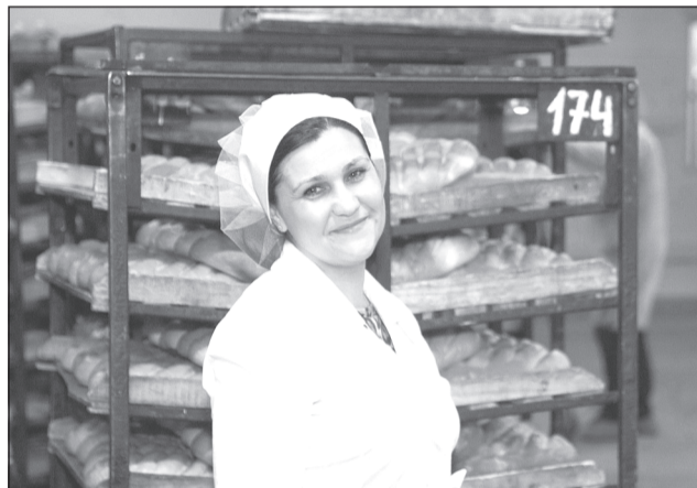
Производителям муки и хлеба в регионе в 2021 году окажут поддержку на закупку пшеницы и реализацию продукции.