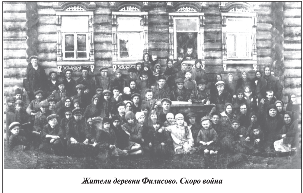
Жители деревни Филисово. Скоро война

да не заканчивались чем-то серьезным: не было травм, увечий. А помирившись, снова вместе отмечали праздники, собирались на вечерки, провожали в армию. На втором фото — как раз такие проводы. И из всех парней,