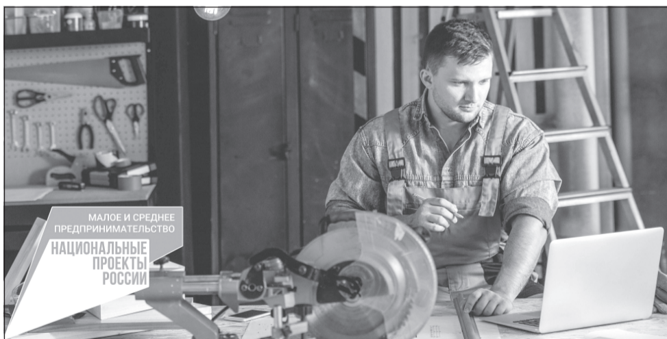
Самозанятые граждане смогут пользоваться мерами господдержки наряду с малым и средним бизнесом

«По последним данным у нас в регионе зарегистрировано почти 9,2 тысячи самозанятых. Получение господдержки открывает для них новые